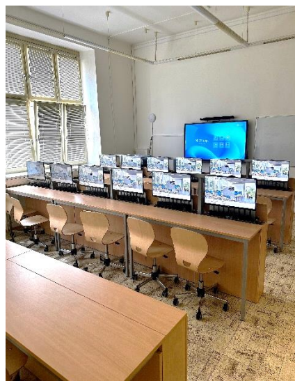
Obrázek 15: Nová učebna IT

Učebnice pro žáky jsme nenakupovali, pouze pro vyučující. Nákup žákovských učebnic byl pouze centrálně organizován. Aktualizovali jsme odborné učebnice dle platné legislativy, zejména v oboru účetnictví, měnily se učebnice pro výuku cizích jazyků a nakoupily se učebnice a učební materiály pro nové členy pedagogického