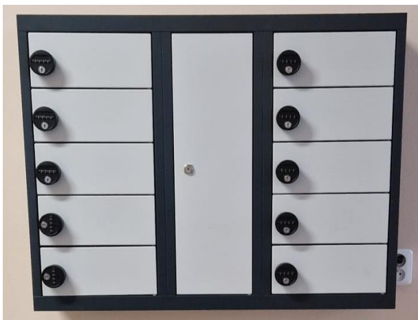
Obrázek 1: Dobíjecí skříň na mobilní zařízení

I letos se vedení města Slaného rozhodlo podpořit kreativitu studentů formou projektu s názvem 20 000 do škol. Letos se tohoto projektu zúčastnily v rámci výuky ekonomiky 3. ročníky a dohromady předložily 4 velice povedené projekty. Prezentační schopnosti našich žáků, na které na naší škole klademe důraz hned v několika předmětech. Utkaly se mezi sebou tyto projekty: nabíjecí skříň, dvě varianty klubovny a slunečníky na školní zahradu.