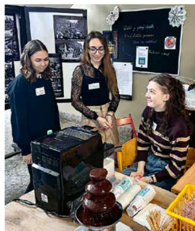
▲ Na dnu otevřených dveří prováděli školou studenti.

ními informacemi o přijímacím řízení a jeho kritériích, učebním plánu jednotlivých oborů, představení oborů a sepsané odpovědi na nejčastější otázky, dále podrobný program a kartičku pro záznam návštěvy jednotlivých stanovišť. Poté byli jednotlivci či skupinky za doprovodu studentů provedeni celou budovou a všemi stanovišti. Na některých si mohli s rodiči nebo našimi žáky zahrát stolní fotbalik či digitální piškvorky na panelu AMOS, navštívit školní posilovnu nebo původní historickou učebnu fyziky. Na dalších stanovištích se uchazeči a jejich rodiče dozvěděli informace o jednotlivých předmětech a mohli se zapojit do zajímavých aktivit a kvízů. Na závěr prohlídky byla prezentována moderní IT učebna s elektronickým výsuvem LCD panelů přímo ze žákovských stolů a prezentace ředitele školy včetně jeho odpovědi na nesčetné množství dotazů rodičů a budoucích žáků. V případě, že uchazeči prošli alespoň polovinu stanovišť a vyplnili dotazník spokojenosti, získali malý dárek v podobě teplého nápoje dle vlastního výběru.