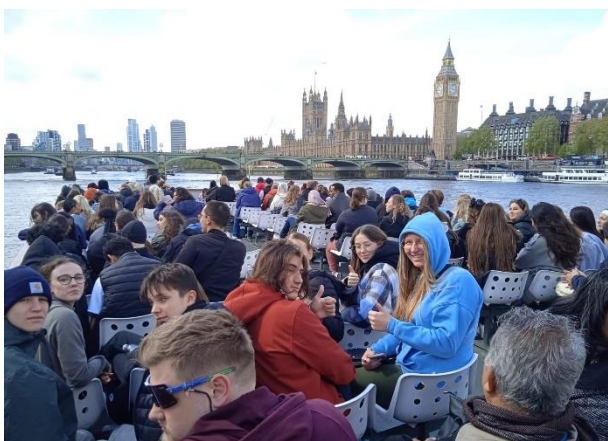
Obrázek 12: Projížďka lodí po řece Temži

Ve dnech 27. 4. až 1. 5. se 32 žáků se dvěma pedagogy vydalo poznávat krásy Anglie. Protože 5 dní není nijak dlouhá doba, vyrazili letecky, aby čas maximálně využili. Hned po příletu se ubytovali v centru Londýna u slavného Hyde parku a vydali se na obhlídku těch nejslavnějších památek. Přes Hyde Park a Regent's Park (kde nechybělo krmení veverek), kolem Buckinghamského paláce k ikonickému Big Ben a až na Trafalgarské náměstí. I když předpověď počasí nezklamala a pěkně jsme promokli, náladu nám zachránila výborná večeře v Čínské čtvrti.