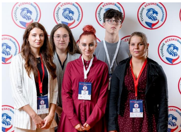
Obrázek 20: Studenti na konferenci