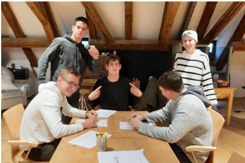
Obrázek 24: Studenti ve zkušebně Národního divadla

Jak dlouhé je 19. století? A kolik ikonických literárních a výtvarných děl během něj vzniklo? Odpovědi na tyto otázky hledali 27. a 28. listopadu 2023 studenti 2. ročníku ve zkušebně Národního divadla a v Národní galerii.