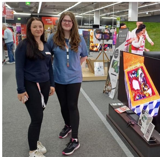
Obrázek 8: Studentky na praxi

V průběhu praxe žáci navštěvovali dvě německé firmy – MediaMarkt a Deco-markt. Jednou týdně také docházeli do místní školy, kde účastnili výuky odborných předmětů a angličtiny. V MediaMarktu měli možnost se naučit, jak fungují online objednávky, jak objednávku následně zabalit, jak upravit ceny zboží, nebo si mohli vyzkoušet, jak funguje práce ve skladu. V druhé firmě Deco-markt si vyzkoušeli i manuální práci, při které dojížděli k zákazníkům domů na zakázky. Zkusili si také vybalování zboží nebo práci s barvami.