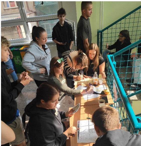
Obrázek 25: Žáci při řešení kvízů

V úterý 26. září se naše škola stala místem plným hudby a her, kde studenti a učitelé prozkoumávali různé evropské jazyky a kultury. Akce zahrnovaly tradiční tance, hudbu a kulinářské speciality. Studenti prezentovali své znalosti angličtiny, ruštiny, němčiny, španělštiny a francouzštiny prostřednictvím her, kvízů a prezentací.