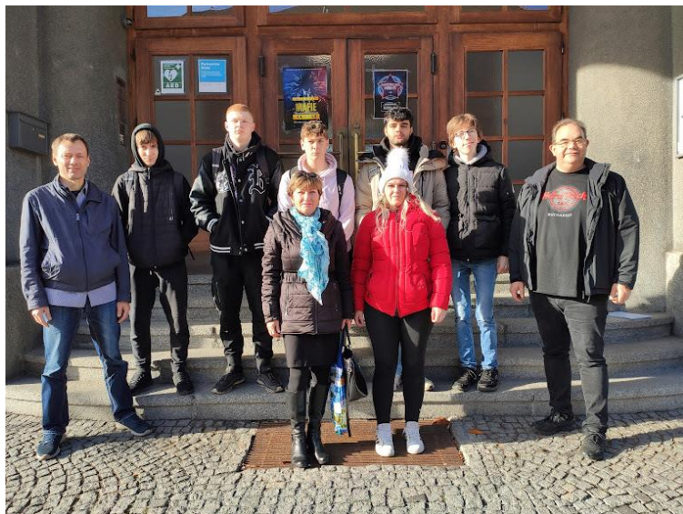
Obrázek 7: Studenti z Goslaru se svými učiteli

Tento výměnný pobyt byl realizován od 6. 11. do 16. 11. 2023 ve Slaném. Hlavním úkolem bylo především poznávání kultury, historie a současnosti Slaného, návštěva vlastivědného muzea a přijetí u pana starosty na Městském úřadu, prohlídka Prahy, Terezína, Lidic a seznámení se s hospodářským regionem Slánsko. Exkurze proběhly ve firmách LINET, Mitsubishi, Konecranes Demag a F. X. Meiller. Tématem projektu byla udržitelnost a ochrana klimatu jako součást výrobního procesu, zpracování materiálů a recyklace odpadů.