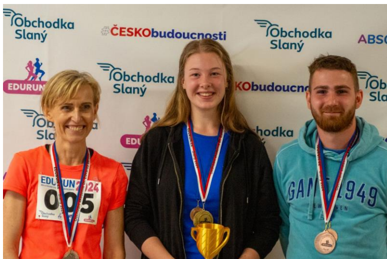
Obrázek 27: Vítězové 1. ročníku EDURUN 2024

EDURUN je běh a pochod studentů a absolventů slánské obchodní akademie, který se konal v sobotu 1. června 2024. Tato akce byla organizována samotnými studenty a kombinuje sportovní aktivity s rozvojem organizačních a týmových dovedností.