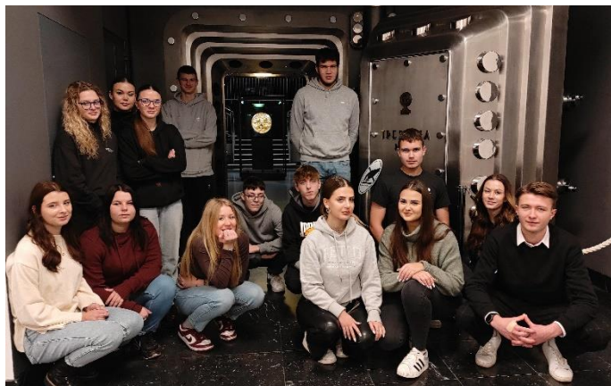
Obrázek 21: Studenti před trezorem ČNB

V prosinci se třetí ročníky naší školy zúčastnily exkurze do České národní banky. Navštívili jsme expozici „Lidé a peníze“ a ponořili jsme se do světa měnicí se historie a role peněz ve společnosti. Naše exkurze začala uvnitř impozantní budovy ČNB, kde jsme byli vřele přivítáni odborným průvodcem. Během naší prohlídky jsme se dozvěděli o různých typech měn, jak se vyvíjela jejich podoba a jaký vliv měly po staletí na životy lidí. Interaktivní prvky expozice nám umožnily prakticky zažít, jak lidé v minulosti obchodovali a jak se měnily obchodní vztahy v průběhu času. Měli jsme možnost nahlédnout do trezoru ČNB, kde je hlídána