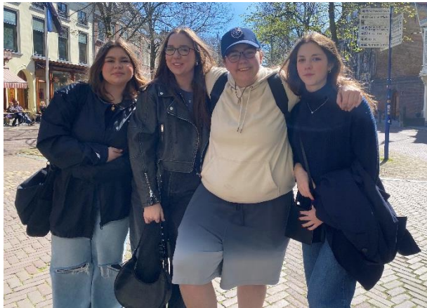
Obrázek 10: Žákyně 2. B

Zájezd začal večerním odjezdem od školy a první zastávkou byl skanzen Zaanse Schans, kde účastníci viděli unikátní větrné mlýny, výrobu dřeváků a ochutnali známé holandské sýry Gouda a Eidam. Poté navštívili Madurodam, kde je nadchly zmenšené modely významných historických i současných staveb Nizozemska, které byly detailně propracované a interaktivní.