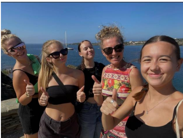
Obrázek 11: Studentky spolu s paní učitelkou

V týdnu od 9. do 13. října 2023 navštívilo dvacet osm studentů španělštiny spolu se svými pedagogy Katalánsko. Po dvouhodinovém letu dorazili do Barcelony, kde navštívili baziliku Sagrada Familia, arénu na býčí zápasy a moderní katalánské divadlo. Poté se přesunuli do města Calella. Druhý den strávili v Barceloně, kde prozkoumali bulvár Las Ramblas, tržnici La Boquería, muzeum Moco a místní akvárium.