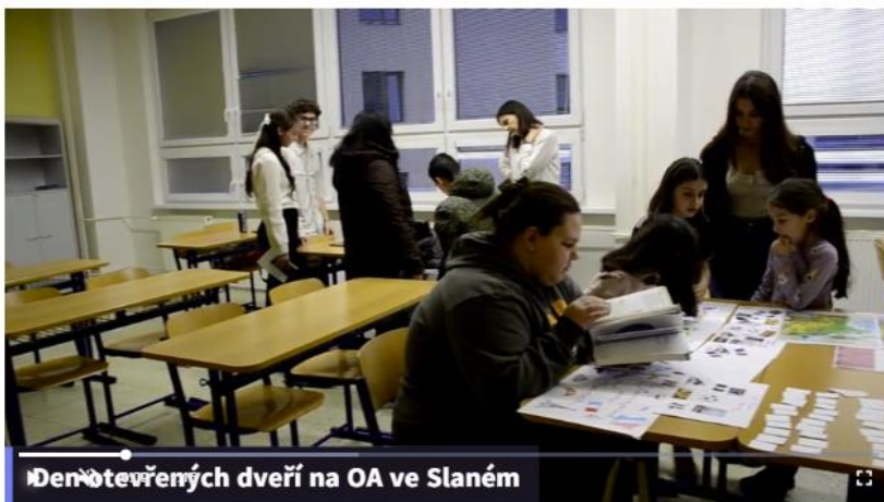
Den otevřených dveří na OA ve Slaném