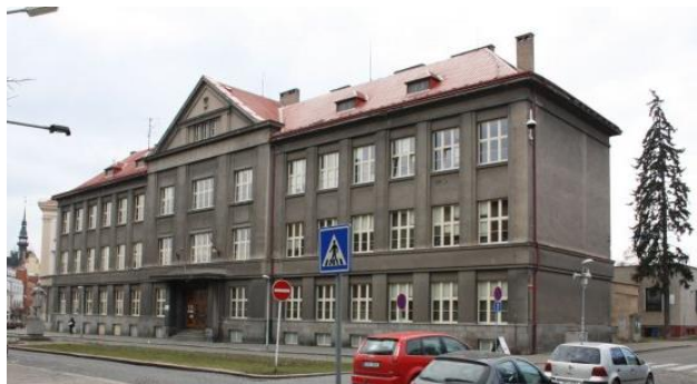
Obrázek 13: Stará historická budova

Škola sídlí ve dvou budovách, které jsou majetkem města Slaný. Budovy jsou stavebně propojeny spojovacím krčkem. Stará budova je z roku 1932, nová budova byla zkolaudována v roce 1994.