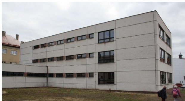
Obrázek 14: Nová budova – přístavba