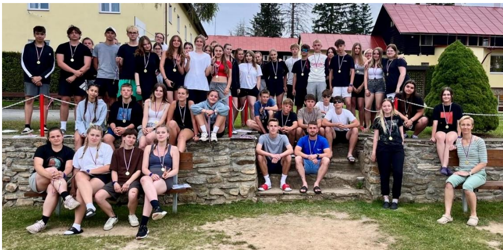
Obrázek 17: Sportovní kurz 2024

Sportovní kurz pro žáky prvních ročníků zařazujeme na konec školního roku. Je to aktivita dobrovolná nad rámec studijních povinností a pravidelně ji organizujeme v kempu ve Zbraslavicích. Hlavní náplní kurzu byly kolektivní sporty jako fotbal, volejbal, ringo a softbal. Kromě toho také žáci