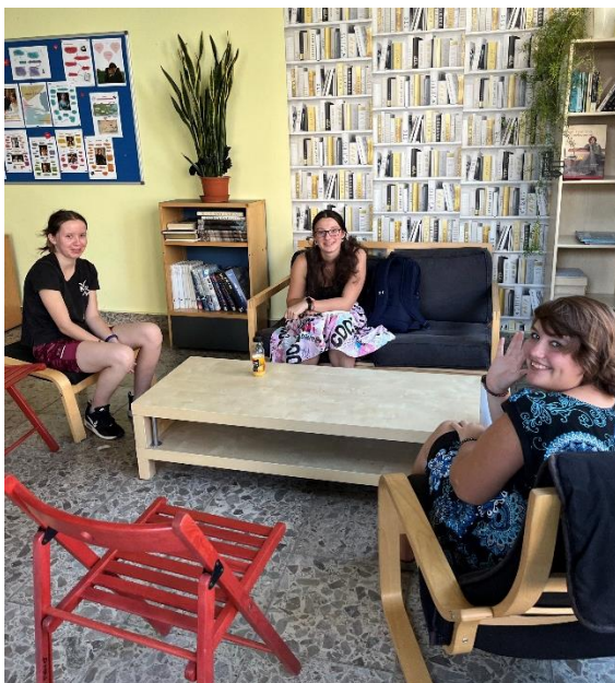
Obrázek 26: Noc literatury

20. 9. 2023 se na různých místech České republiky konala Noc literatury, série veřejných čtení, jejímž cílem je zvýšit zájem o současnou evropskou literaturu.