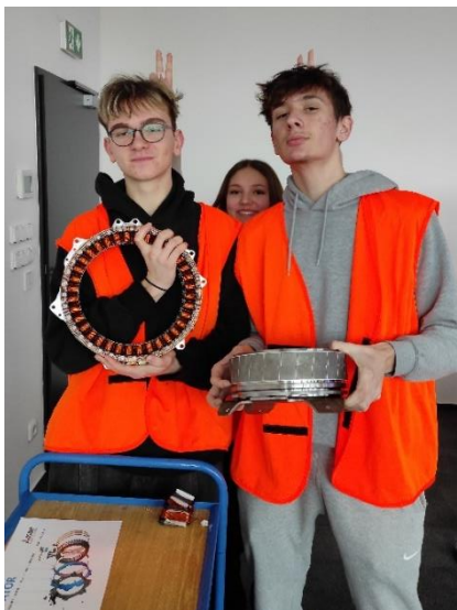
Obrázek 22: Studenti ve výrobním závodě

13. 2. 2024 tříd 1. A navštívila společnost MITSUBISHI ELECTRIC AUTOMOTIVE CZECH s.r.o. (MEAC) ve Slaném. MEAC byla založena v červnu roku 2000 jako dceřiná společnost mateřského závodu MITSUBISHI ELECTRIC CORPORATION sídlícího v Japonsku. V současné době firma zaměstnává okolo 750 zaměstnanců. Její hlavní poslání spočívá ve výrobě a dodávkách elektrických rotačních a elektronických součástí pro automobilový průmysl pro evropský trh.