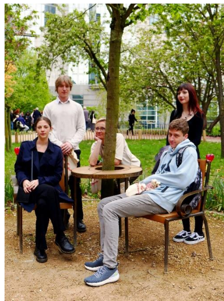
Obrázek 9: Vybraní studenti zájezdu

Antverpy připomínaly Kladno svou industriální zónou a historickým jádrem, které bylo velmi zachovalé a útulné. Lovaň byla plná mladých lidí a restaurací různých kultur, což přispělo k živé atmosféře města. Celý zájezd tak ukázal nejen krásy navštívených míst, ale i pestrost a rozmanitost evropského společenství.