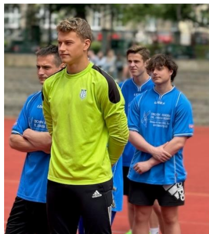
Obrázek 2: Futsalový tým OA Slaný