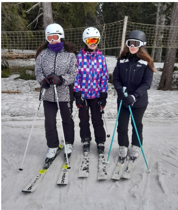
Obrázek 18: Lyžařky z druhého ročníku

Téměř 60 žáků školy si sbalilo lyže či snowboard a v neděli 17. března vyrazilo do Janských Lázní na lyžařský kurz. Přestože jim sněhové podmínky nepřály, kurz se konal v plném rozsahu.