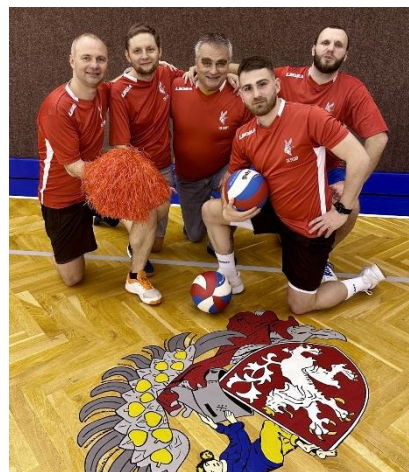
Obrázek 3: Volejbalový tým OA Slaný

Je málo aktivit mezi školami, které by trvaly tak dlouho. Všichni zúčastnění se znovu dohodli na pokračování tohoto prestižního volejbalového turnaje Jiskry a Pobudy a těšíme se příště do Rakovníka.